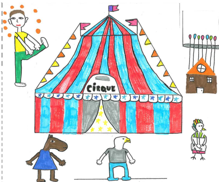
Projet « c'est le cirque ici ! » par les 6ème en arts plastiques.